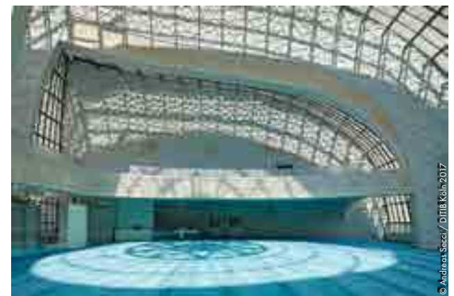
Oben: Blick in die Kuppel mit Kronleuchter Mitte: Lehrkanzel, Vorbeterische, Predigtkanzel Unten: Blick zur linken Seite des Gebetsaals